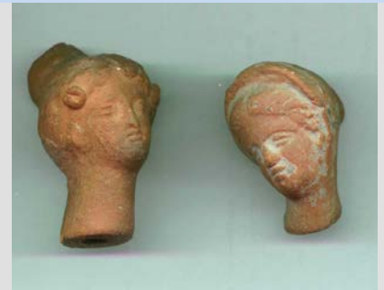
Figurillas de terracota Paestum

También se continuó con la tarea iniciada en el período anterior de recopilación de materiales diversos (doctrinas de filósofos, fábulas y mitos ). Esto dio origen a lo que se ha dado en llamar género antológico .